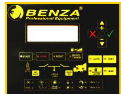
Fig.2 Controlerul digital al panoului de transfer sarcina